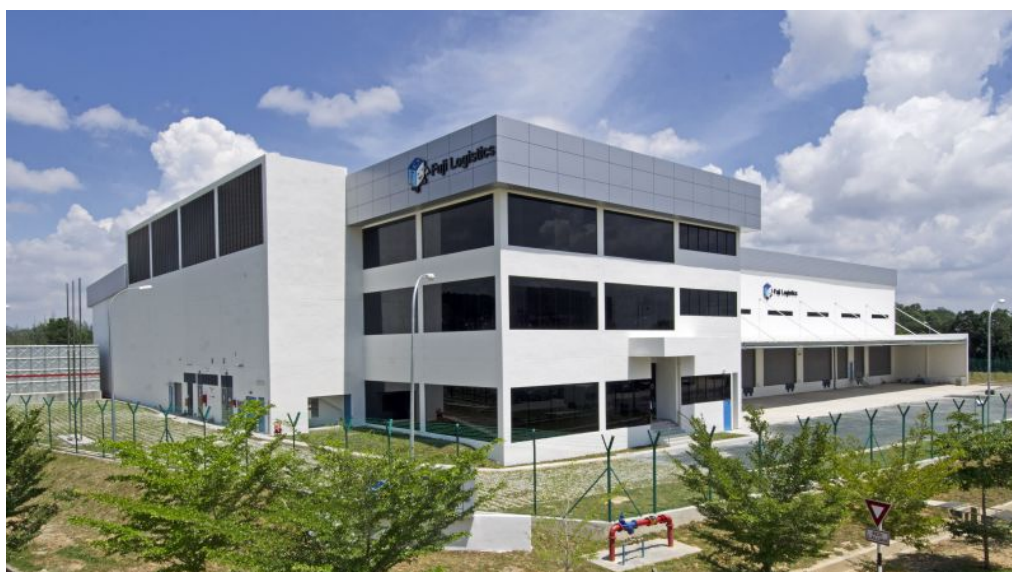
クリムロジスティクスセンター外観